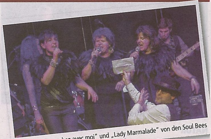
„Voulez vous coucher avec moi“ und „Lady Marmalade“ von den Soul Bees