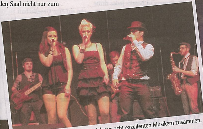
Die Stammtruppe von TMMC setzt sich aus acht exzellenten Musikern zusammen.