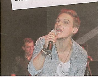
Eastwood Haze rockte das Publikum.